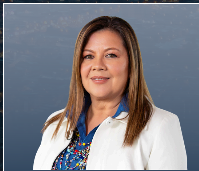
LUZ ADRIANA CAMARGO Fiscal General de la Nación