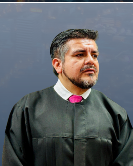
MIGUEL ANDRÉS LUNA

Magistrado Sala Penal de la Corte Suprema de Justicia