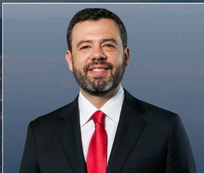
CARLOS FERNANDO GALÁN Alcalde Mayor de Bogotá