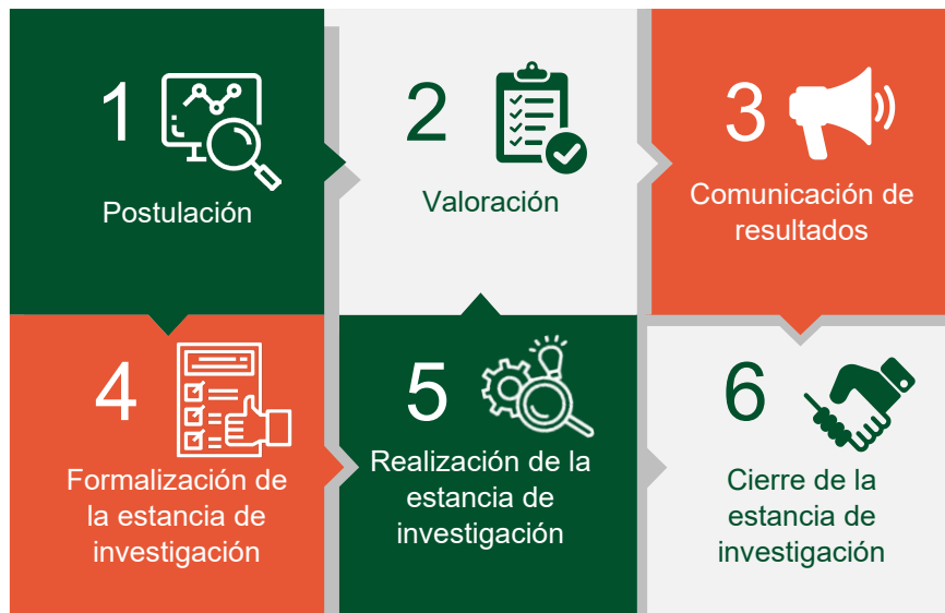
Figura 2. Etapas para la postulación y desarrollo de estancias de investigación.