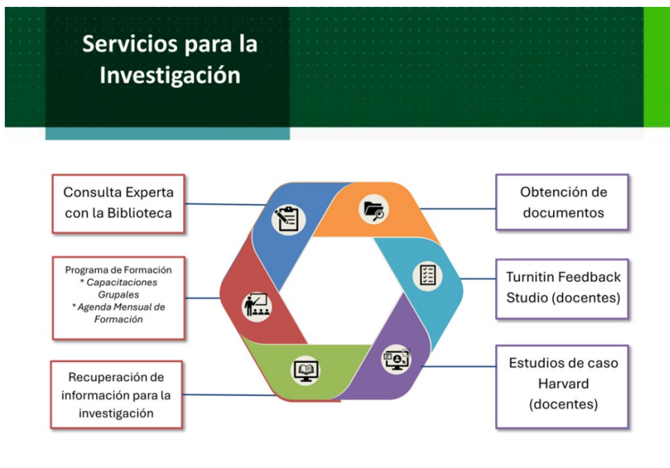
Figura 1. Servicios para la Investigación