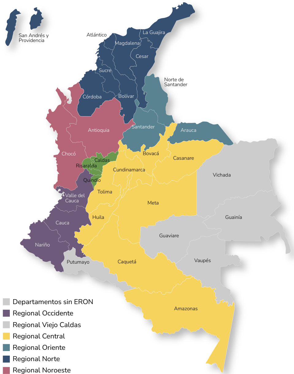
Ilustración 2. Jurisdicción departamental, Direcciones Regionales del INPEC

De forma paralela y simultánea al ordenamiento de los archivos, el Consejo de Evaluación y Tratamiento -CET- de cada ERON realizará jornadas de verificación y actualización de la clasificación de las fases de tratamiento penitenciario de la PPL bajo su cargo, dado que este es un criterio esencial en el otorgamiento de beneficios administrativos y subrogados penales según sea el avance del proceso de resocialización.