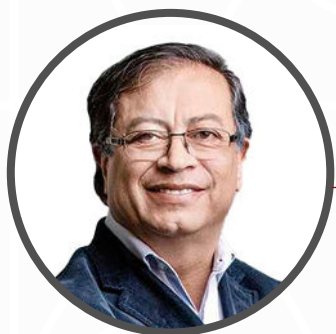
Gustavo Petro Urrego