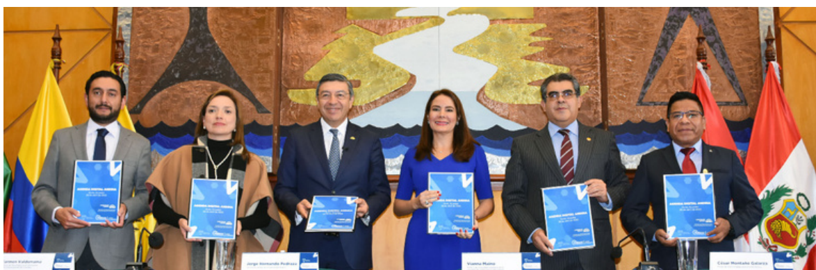
La Agenda Digital Andina fue presentada en la ciudad de Quito, Ecuador el 28 de abril de 2022, en el marco del XXIX Comité Andino de Autoridades de Telecomunicaciones (CAATEL)

Con el diseño y la puesta en marcha de una estrategia subregional, materializada en la Agenda Digital Andina (ADA), se busca orientar de manera estratégica los retos que Bolivia, Colombia, Ecuador y Perú afrontan para alcanzar la transformación digital y mejorar la conectividad e innovación a través del uso de las TIC.